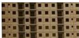
CETAC Centro Tecnológico do Ambiente Construído