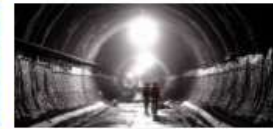
CT-OBRAS Centro de Tecnologia de Obras de Infraestrutura