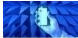
CIAM Centro de Tecnologia da Informação, Automação e Mobilidade