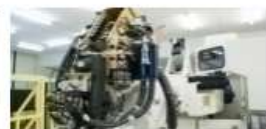
LEL Núcleo de Estruturas Leves