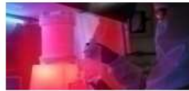
CQuiM Centro de Química e Manufaturados