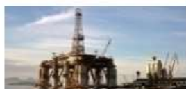
Petróleo e Gás