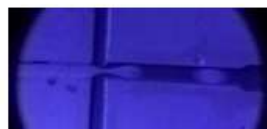
BIONANO Núcleo de Bionanomanufatura